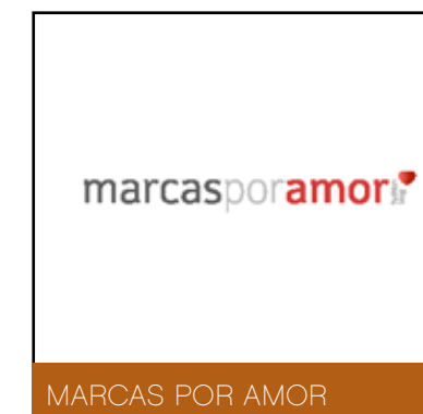
MARCAS POR AMOR

E Private Collection is a private atelier which emerges as a complement to the information service provided by Luxo.com. It is a selective service by Concierge for those who consider the trivial and second choice insufficient. Working 24 / 7, it can help you in every area you are interested in, both in Portugal and abroad. Everything depends on your needs! By becoming a member, you can enjoy a number of benefits related to priority reservations, promotions, privileged information, tailor-made services, up-grades and others, but what is most important is that you will have the permanent support you need to facilitate your life so as you can take full advantage of your time.